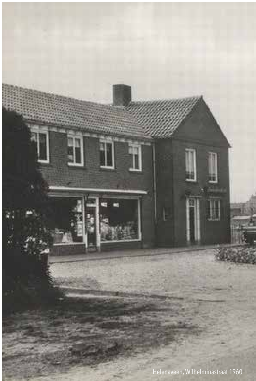
Helenaveen, Wilhelminastraat 1960