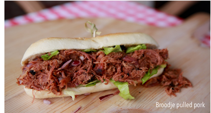
Broodje pulled pork