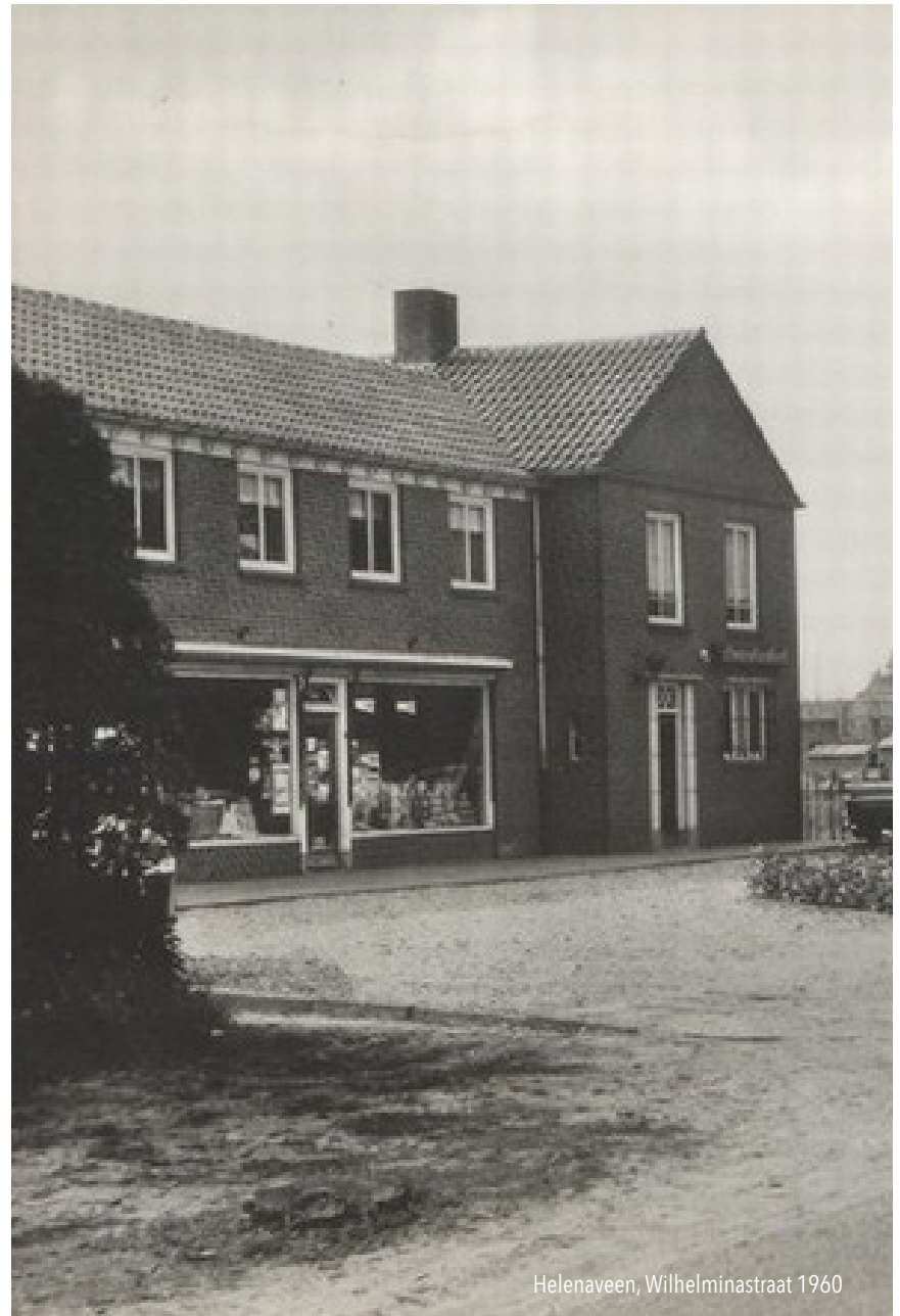
Helenaveen, Wilhelminastraat 1960