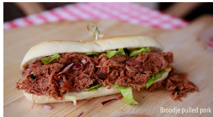
Broodje pulled pork