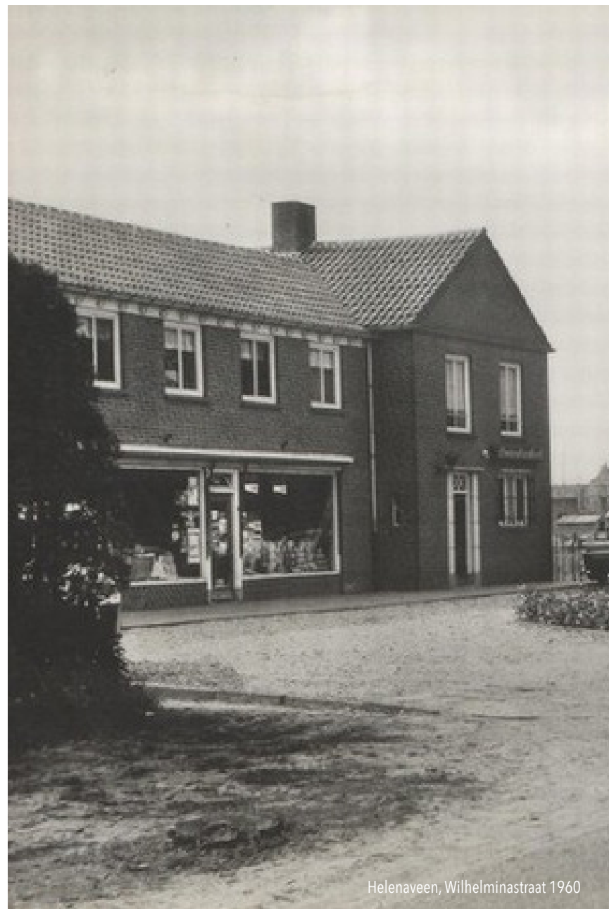
Helenaveen, Wilhelminastraat 1960